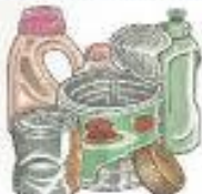
PLASTICA E METALLI