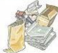
CARTA E CARTONE